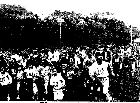
3キロコースのスタート

【駒ヶ根】駒ヶ根市民トリムマラソンは、11月10日、駒ヶ根市立総合運動場で行われた。参加者は350人を超え、3キロと5キロの二つのコースで競走した。大会は、市民の健康増進と、地域活性化を目的として開催された。参加者は、好成績を挙げ、大会は大成功に終わった。