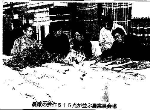
農家の秀作515点が並ぶ農業展会場

「看護用品ファッションショー」は、生活部会大会の一環として開催された。看護用品の展示とファッションショーが行われ、参加者から好評を博した。また、会場には様々な農産物の展示もあり、地域の特産品をアピールした。