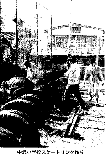
中沢小学校スケートリンク作り

駒ヶ根市中沢小学校のPTAと教師ら十五人が、スケートリンク場の造成に力を入れている。リンク場の造成は、児童たちの冬のレクリエーションの場として、大変喜ばれている。