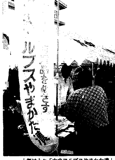
人気は上々「中央アルプスやまかた」演

駒ヶ根市のヤマウド生産組合が、試食販売を行っている。人気の「やまかた」演は、地域の伝統文化を継承し、観光資源として活用されている。