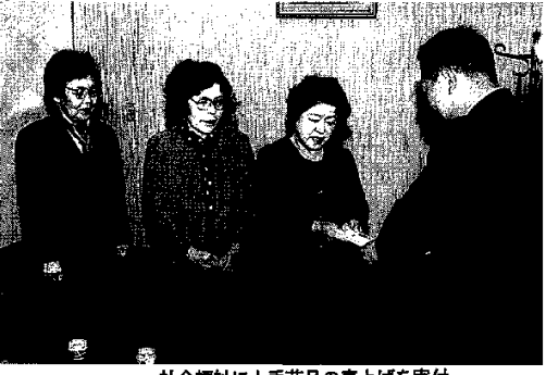
社会福祉にと手芸品の売上げを寄付

町民文化祭初日に行われたバザーの売上げ金四万六千円が、福祉基金に寄付された。町役場では、この寄付金を活用して、福祉事業の推進を図っていく方針だ。