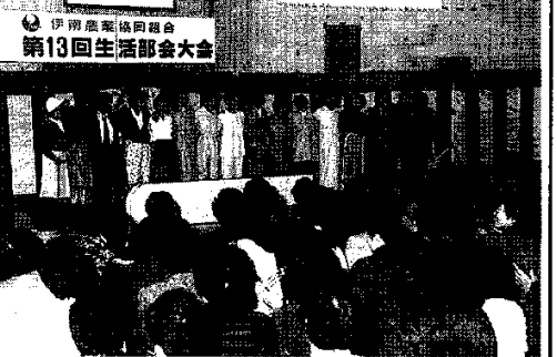
生活部会大会の「看護用品ファッションショー」

「看護用品ファッションショー」は、生活部会大会の一環として開催された。看護用品の展示とファッションショーが行われ、参加者から好評を博した。また、会場には様々な農産物の展示もあり、地域の特産品をアピールした。